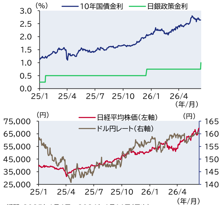
図表1: 政策金利、長期金利、株価、為替の推移

期間: 2025年1月6日～2026年6月16日(日次) 日銀政策金利のみ6月17日まで