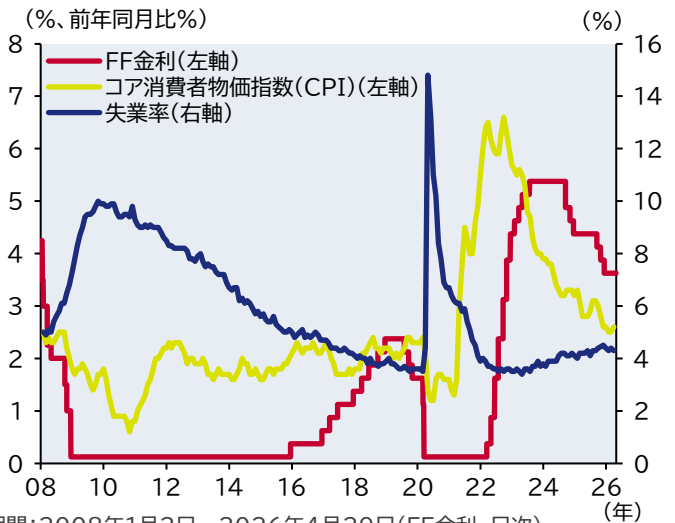
図表1:政策金利・失業率・物価の推移

期間:2008年1月2日~2026年4月29日(FF金利、日次) 2008年1月~2026年3月(コア消費者物価指数(CPI)、月次) 2008年1月~2026年3月(失業率、月次) 出所:LSEG、ブルームバーグのデータを基にアセットマネジメントOneが作成 (注)2008年12月16日以降、FF金利は誘導目標レンジの中央値を表記。 コア消費者物価指数(CPI)と失業率の2025年10月の数値は欠測。