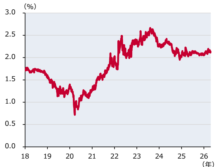
図表2:5年先5年物スワップ金利

期間:2018年1月1日~2026年4月22日(日次)