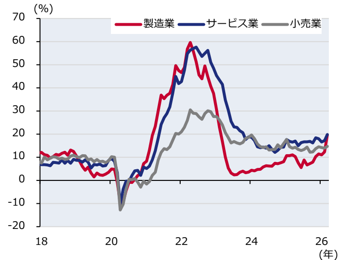
図表3：欧州委員会：企業の販売価格見通し

※調査実施後の今後3か月について販売価格が上昇すると見込む回答者の割合から、低下すると見込む回答者の割合を差し引いたものを示す。 期間：2018年1月～2026年3月(月次)