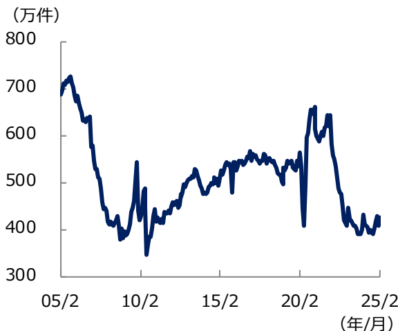
米 中古住宅販売件数の推移 (1)

中古住宅販売件数は増加したものの、一戸建て住宅市場の動きは総じて緩慢といえることから、今後の動向に注視が必要です。