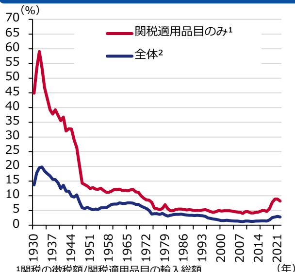
図表2 米国の平均関税率

期間：2008年1月2日～2025年1月29日（FF金利、日次） 2008年1月～2024年12月（コア消費者物価指数(CPI)、月次） 2008年1月～2024年12月（失業率、月次） （注）2008年12月16日以降、FF金利は誘導目標レンジの中央値を表記