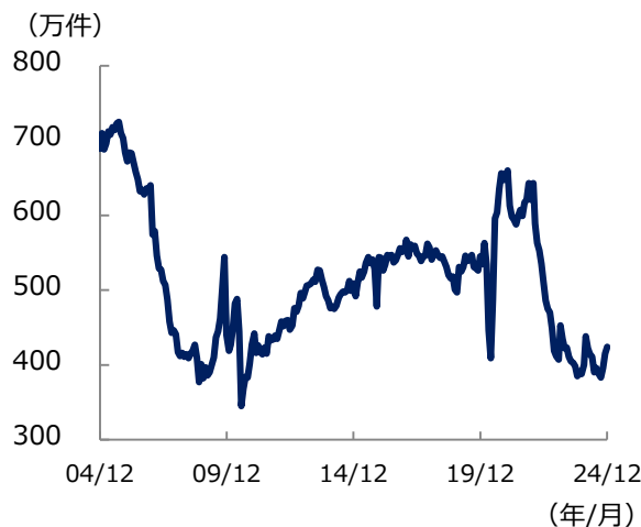
米 中古住宅販売件数の推移

住宅ローン金利が高止まりの傾向にあるなか、より高価格の物件の販売増加が中古住宅販売件数の持ち直しをけん引するかたちとなっており、こうした動きが継続するか注目されます。