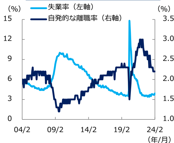
米 失業率と自発的な離職率の推移