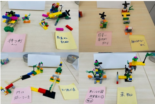
ワークショップ前後での投資のイメージの変化 (ワーク前：黄色付箋、ワーク後：ピンク付箋)