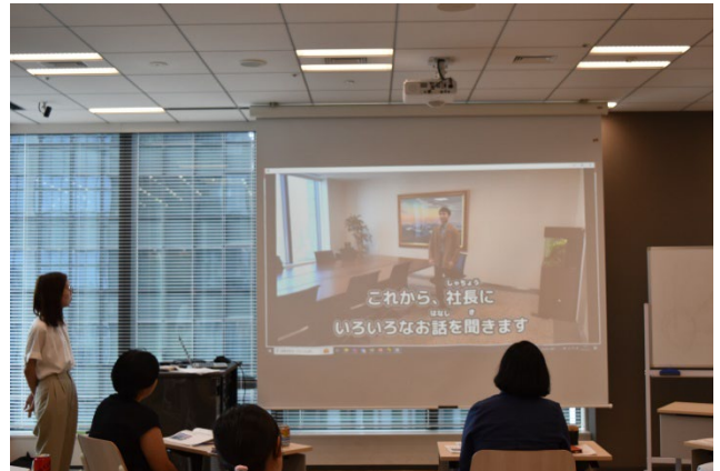
「キッズニア オンラインカレッジ」 ファンドマネジャーコースの体験