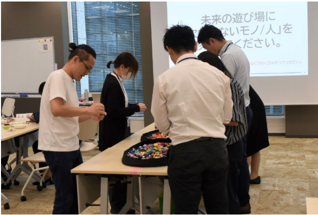
レゴブロックで作品作り