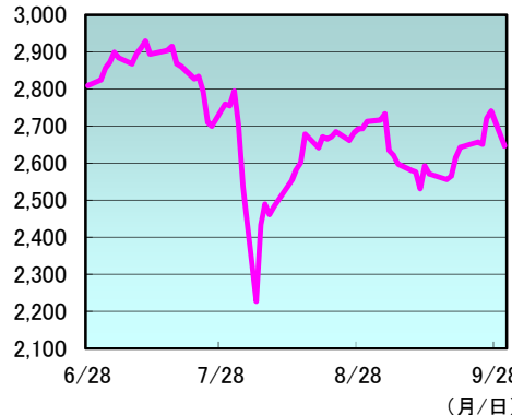
東証株価指数(TOPIX) の3カ月の推移

東証33業種別指数の騰落率では、上位は「繊維製品」、「空運業」、「倉庫・運輸関連業」、下位は「医薬品」、「鉱業」、「証券・商品先物取引業」などでした。