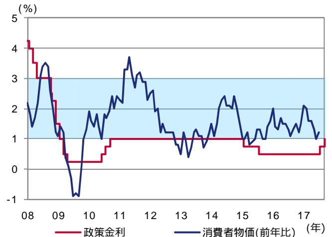
図表1 政策金利と消費者物価