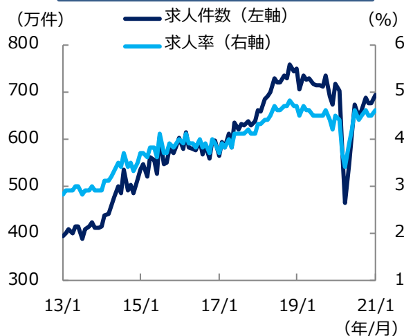
米 求人件数と求人率の推移