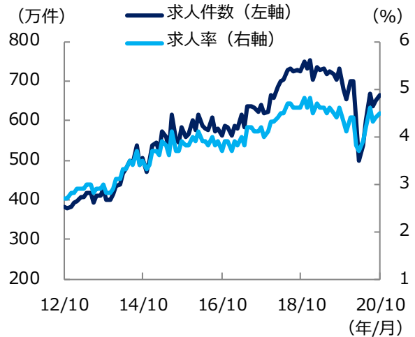
米 求人件数と求人率の推移

米国では、足もとの求人は比較的堅調なものの、採用はやや一服しています。こうしたなか、雇用は鈍化傾向が強まり、失業は深刻な状況になりつつあると考えられることから、引き続き労働市場の動向に注視が必要と思われます。