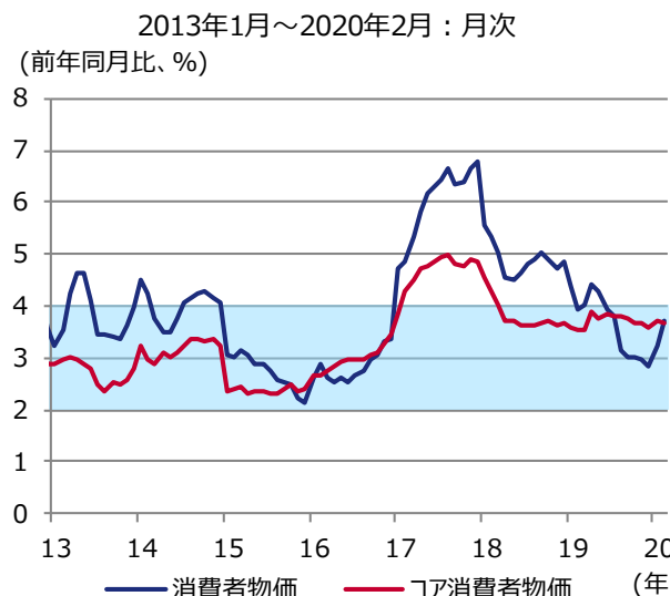
図表2 消費者物価の推移