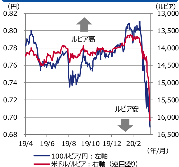
図表2 インドネシアルピアの推移