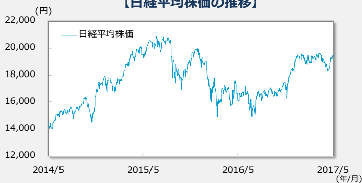
【日経平均株価の推移】