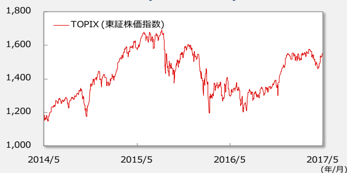
【TOPIX(東証株価指数)の推移】