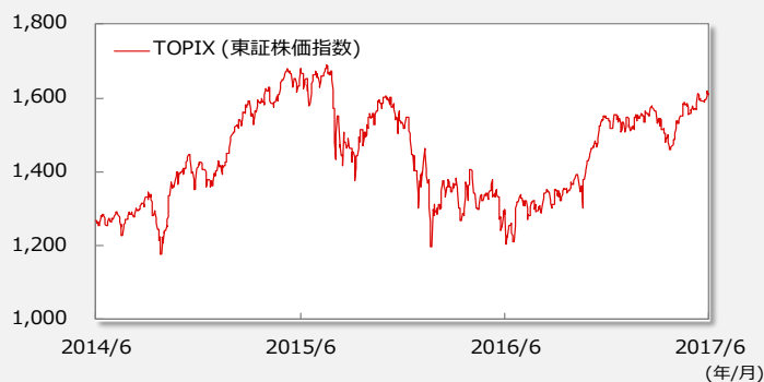
【TOPIX(東証株価指数)の推移】