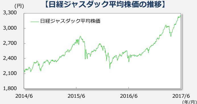
【日経ジャスダック平均株価の推移】