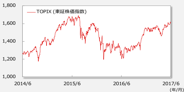
【TOPIX(東証株価指数)の推移】