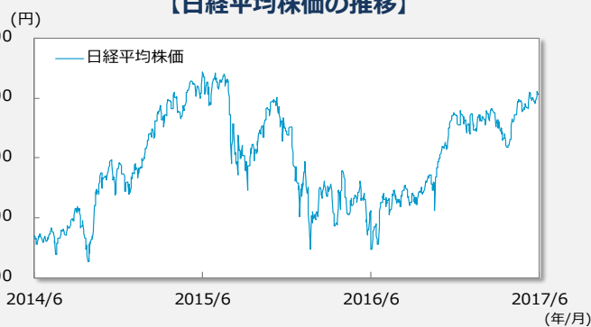
【日経平均株価の推移】