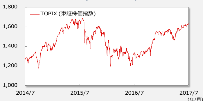
【TOPIX(東証株価指数)の推移】