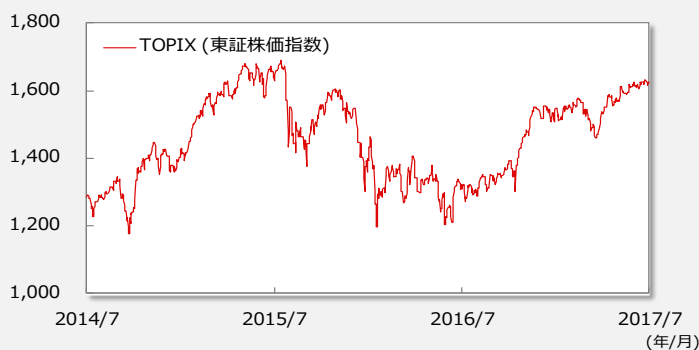
【TOPIX(東証株価指数)の推移】