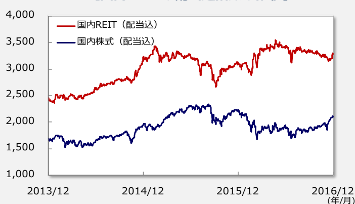
【国内REITの配当込指数の推移】