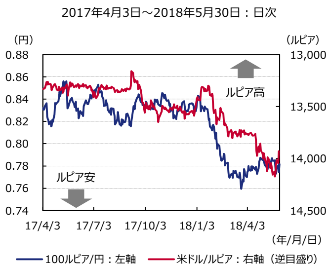
図表2 インドネシアルピアの推移

(注) インドネシア中央銀行は2016年8月19日に政策金利をBIレートからBI7日物リバースレポ金利へ変更