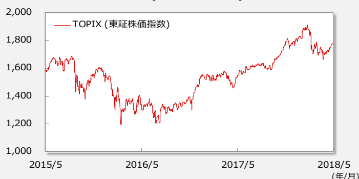
【TOPIX(東証株価指数)の推移】