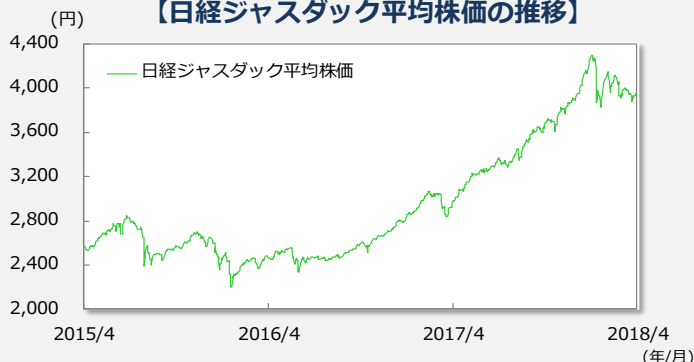
【日経ジャスダック平均株価の推移】