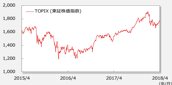
【TOPIX(東証株価指数)の推移】