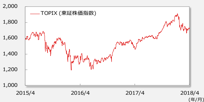
【TOPIX(東証株価指数)の推移】