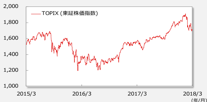
【TOPIX(東証株価指数)の推移】