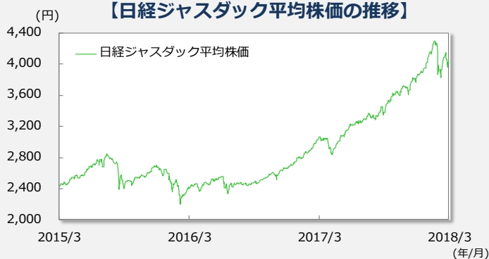
【日経ジャスダック平均株価の推移】