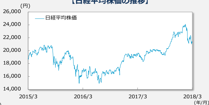
【日経平均株価の推移】