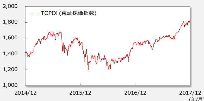
【TOPIX(東証株価指数)の推移】