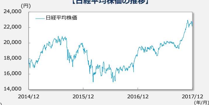
【日経平均株価の推移】