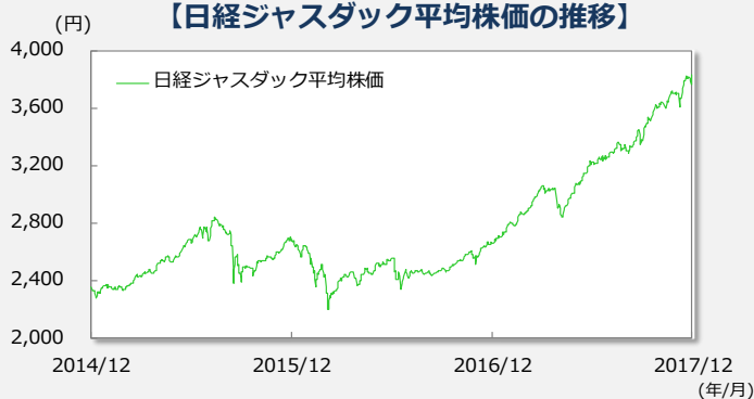
【日経ジャスダック平均株価の推移】