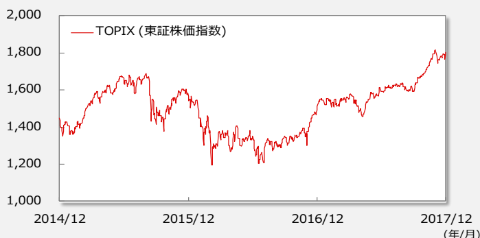
【TOPIX(東証株価指数)の推移】