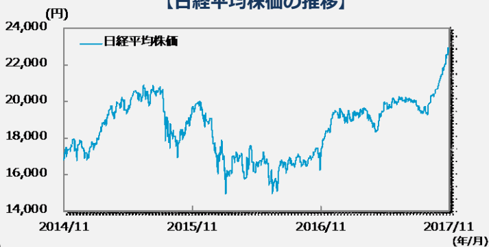
【日経平均株価の推移】