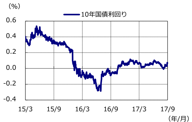
10年国債利回りの推移