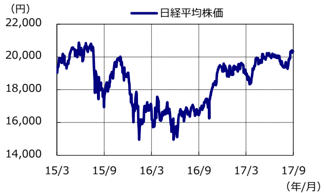
日経平均株価の推移