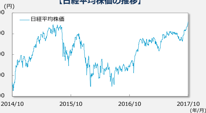
【日経平均株価の推移】