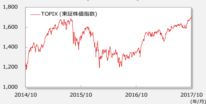
【TOPIX(東証株価指数)の推移】