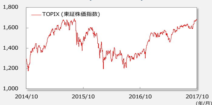
【TOPIX(東証株価指数)の推移】