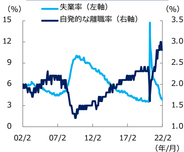
米 失業率と自発的な離職率の推移

※期間：2002年2月～2022年2月(月次) 季節調整済み、自発的な離職率は2022年1月まで