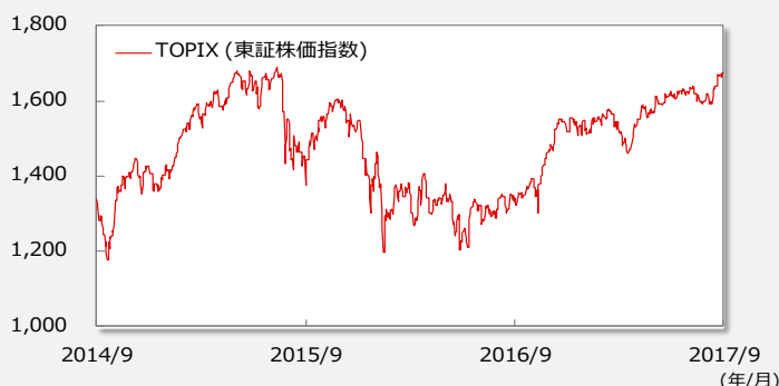
【TOPIX(東証株価指数)の推移】