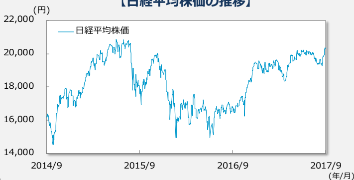
【日経平均株価の推移】