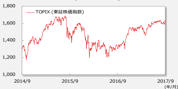
【TOPIX(東証株価指数)の推移】