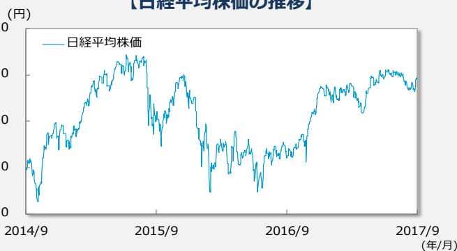
【日経平均株価の推移】