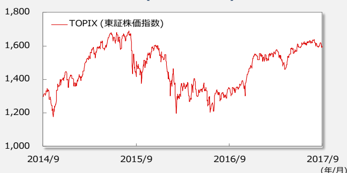
【TOPIX(東証株価指数)の推移】