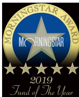
Morningstar Award “Fund of the Year 2019” 国際株式型（グローバル）部門 優秀ファンド賞