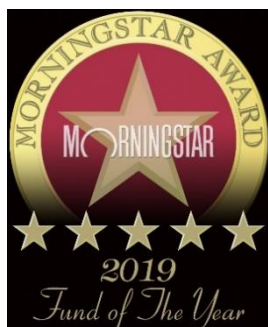
Morningstar Award “Fund of the Year 2019” 国際株式型（特定地域）部門 最優秀ファンド賞

グローバル・ハイクオリティ成長株式ファンド （為替ヘッジなし）（愛称：未来の世界）