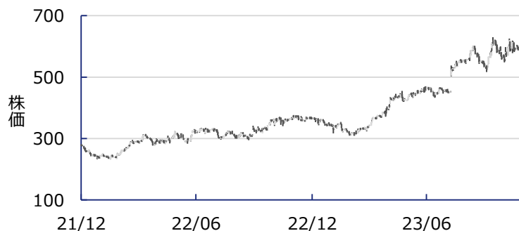
【図表5】イーライ・リリーの株価動向

出所: Bloombergより当社作成(2021年12月30日～2023年11月28日)。個別株式について記載していますが特定の株式の投資を推奨するものではありません。