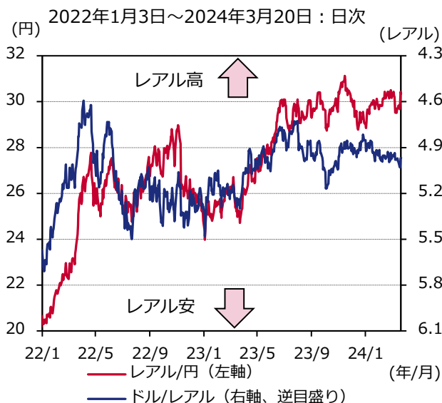
図表2 ブラジルリアルの推移

期間：2008年1月2日～2024年3月20日（政策金利、日次） 2008年1月～2024年2月（拡大消費者物価上昇率、月次）