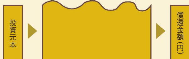
基準価額の推移(イメージ)

当ファンドは、ゴールドマン・サックス社債に集中して投資を行いますので、基準価額は当該債券の価格変動の影響を受けます。